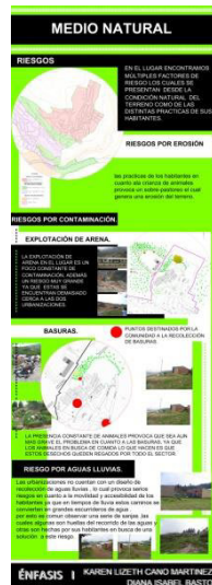
Figura 5. Análisis territoriales

Igualmente se establecen las problemáticas mediante árboles de problemas, determinando las causas de éstas, lo que permite un mejor diagnóstico. Figura 6.