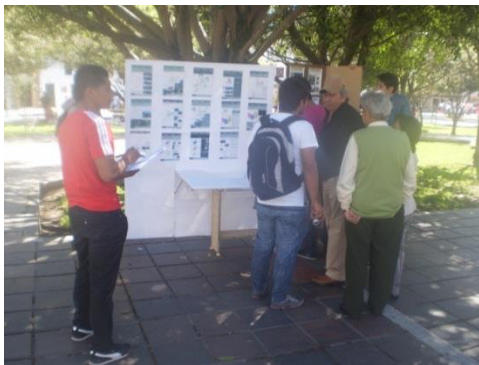
Figura 3. Talleres participativos comunidad de Pamplona en general.

En la aproximación y reconocimiento al área de estudio se tiene en cuenta información de fuentes primarias y secundarias, abordando análisis territoriales desarrollados por los estudiantes y docentes de arquitectura de la Universidad de Pamplona, en donde se privilegian aspectos de la ciudad y el entorno como: ubicación, accesibilidad y movilidad, equipamientos, servicios públicos, zonas verdes, tipología urbana y edificatoria, seguridad y confianza, medio ambiente y ámbitos de participación. Igualmente se analizan las unidades habitacionales destacando dentro de éstas: higiene, privacidad, comodidad, equipamientos, espacialidad y protección de los habitantes