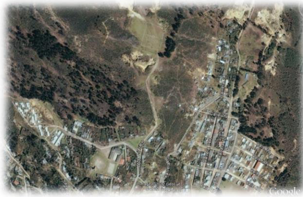
Figura 4. Periferia urbana nor-oriental de Pamplona.