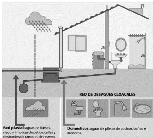
Figura 7. Sistema de captación de aguas lluvias.

alternativas tecnológicas constituyen un conjunto de opciones socioeconómicas y ambientales; que pueden aportar soluciones innovadoras en relación con situaciones locales específicas” (Agenda 21, 1992).