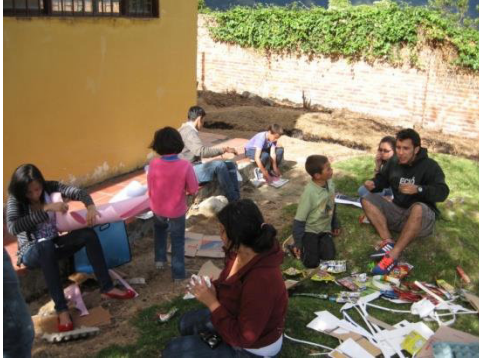
Figura 2. Talleres Participativos habitantes de a periferia urbana