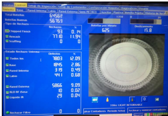
Fig. 2 Porcentajes de rechazo de la línea 750

En la siguiente imagen (figura 2) se muestran los porcentajes de rechazos tan altos que se tenían antes de hacer las respectivas calibraciones y ajustes especialmente en la línea 750.