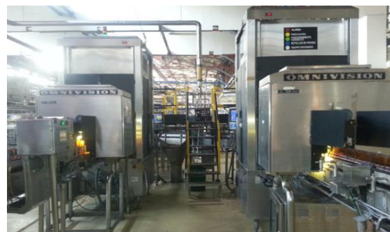
Fig. 1 Inspectores de botella

De acuerdo con (García et al., 2003; Campos,2009) es importante establecer un sistema de gestión para la calidad que este claramente orientado a los procesos y a la mejora continua; Pues, las organizaciones lograrán el liderazgo en la medida que tengan la habilidad para mantener la excelencia de sus procesos y se comprometan con el constante desarrollo de sus objetivos, siempre orientados a la satisfacción de sus clientes.